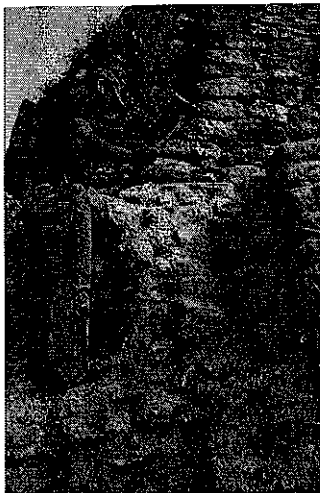
Foto 9. Personal de DECORSIAP durante los trabajos supervisados