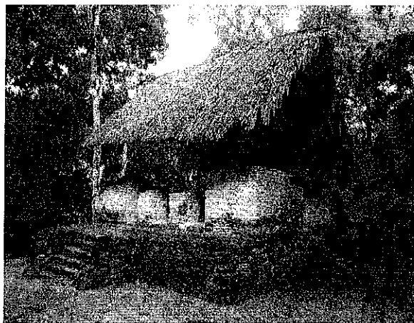
Foto 1. Edificio G, Topoxte