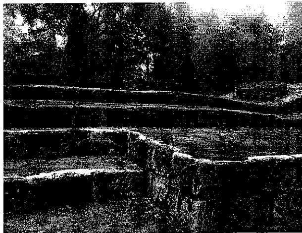
Foto 3. Edificio 90, Plaza B, vista parcial de la escalinata