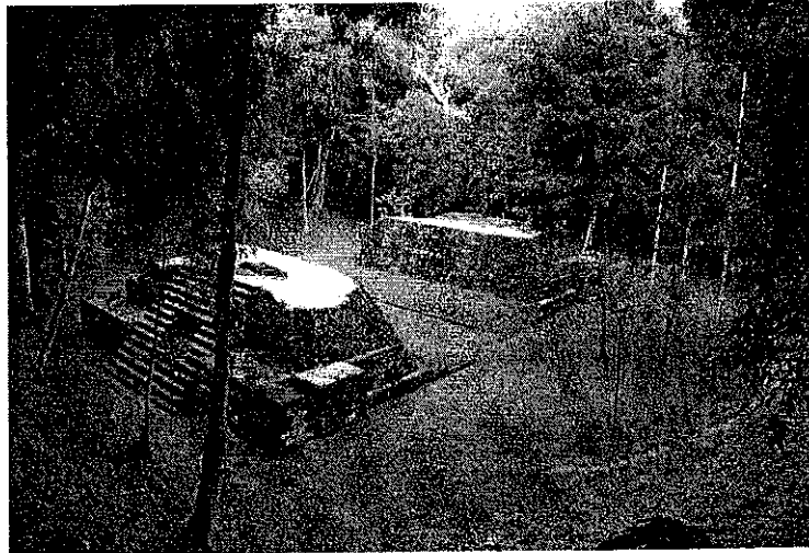
Foto 4. Juego de Pelota I