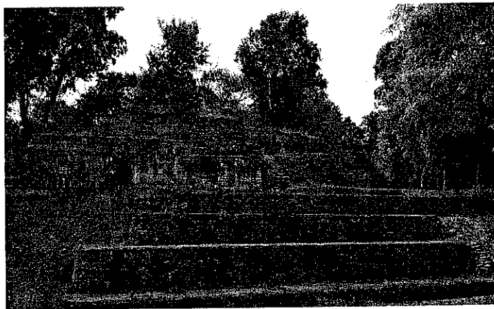
Foto 5. Edificio 6, Grupo Maler