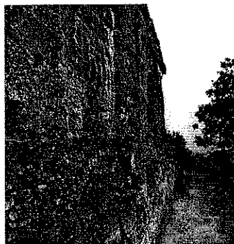
Foto 8. Edificio 216, lado este